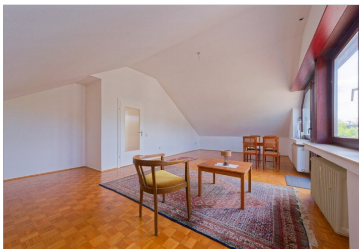
Wohnraum / Zimmer DG