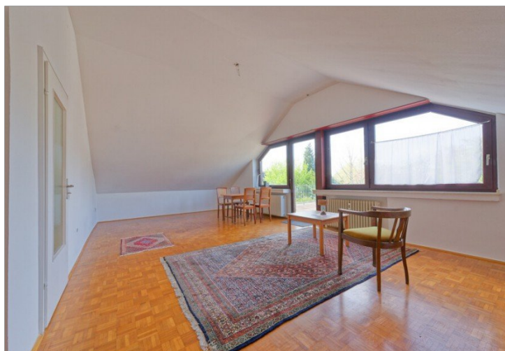
Wohnraum / Zimmer DG